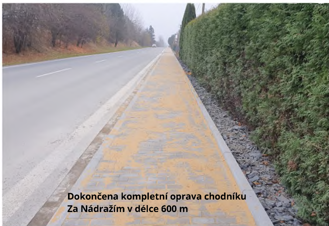
Dokončena kompletní oprava chodníku Za Nádražím v délce 600 m